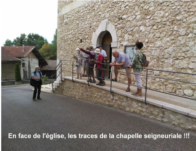
En face de l'église, les traces de la chapelle seigneuriale !!!

Les Journées du Patrimoine 2020 à St-André sont à inscrire dans la Mémoire-Histoire comme bien spéciales par rapport aux précédentes.